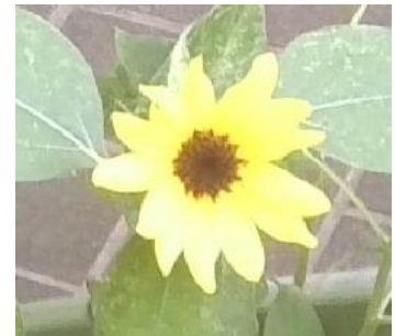
7/17 ひまわり開花!(ボランティア部)