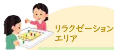
リラクゼーション エリア