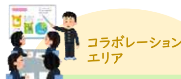
コラボレーション エリア